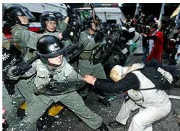
Figura 2: Ilustração do relato do Globo.

É fácil notar que os três relatos colhidos na Internet (mas não o “contra-relato” que construímos a partir deles) concordam numa atitude interpretativa básica, que corrobora o argumento expresso no parágrafo anterior: os manifestantes se “uniram para atacar” e, com isso, “romperam” a barreira policial; os “protestos (mas não a ação policial) foram violentos”; a polícia lutou