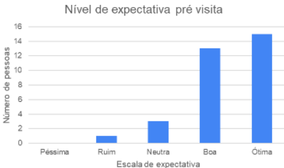
Figura 4: Nível de expectativa pré visita