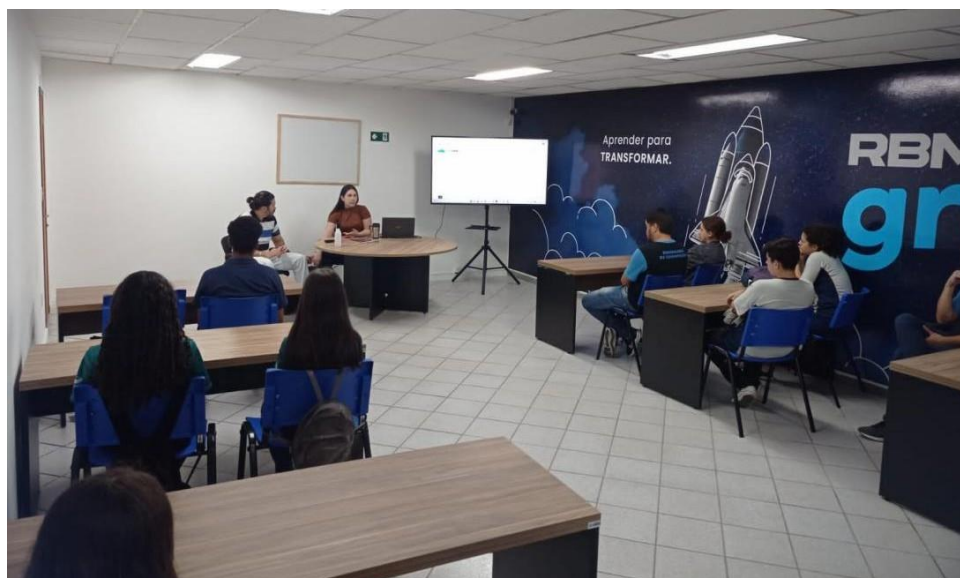
Figura 9: Palestra de apresentação da empresa RBMWeb.

No que tange o conhecimento adquirido sobre a empresa após a visita técnica, houve um