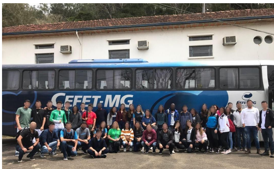
Figura 7: Estudantes durante a visita à empresa Embrapa Gado de Leite

A RBM Web (figura 8) é uma empresa brasileira que oferece soluções tecnológicas para gestão empresarial. Fundada em 2004, a organização tem como objetivo desenvolver tecnologias para auxiliar as empresas a aumentar sua produtividade, eficiência e rentabilidade. A empresa oferece diversas soluções tecnológicas, como sistemas de gestão