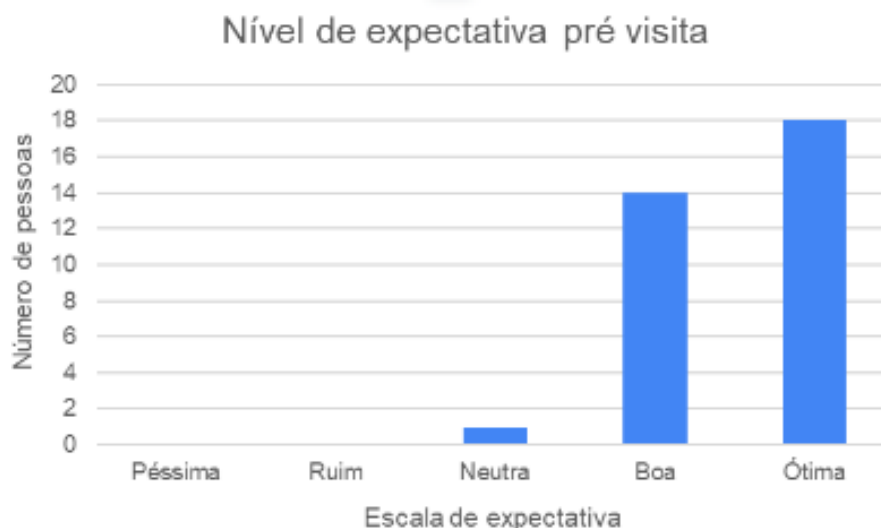
Figura 8: Nível de expectativa pré visita na empresa RBMWeb.

aumento significativo. Foram obtidas 33 respostas no formulário de pós onde 69,7% desses alunos relataram um nível de conhecimento muito alto e 30,3% alto (Na pergunta “Qual seu nível de conhecimento sobre a RBM Web pós visita?”). Isso pode ser explicado pelo feedback positivo dos alunos em relação ao conteúdo apresentado durante a visita. Como esperado, os demais pontos avaliados no questionário também tiveram avaliação positiva, constatando-se que 100% dos alunos tiveram suas expectativas atendidas durante a visita à RBM Web, como apresentadas nas figuras abaixo.