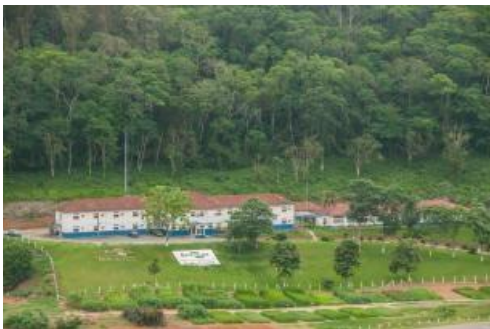
Figura 1: Sede da empresa Embrapa Gado de Leite 15

A Embrapa (Empresa Brasileira de Pesquisa Agropecuária) Gado de Leite (Figura 1) é uma empresa brasileira de pesquisa agropecuária, fundada em 1975 e sediada em Juiz de Fora, Minas Gerais. A organização tem como principal objetivo o desenvolvimento de tecnologias e soluções para a produção de leite, visando aumentar a produtividade, qualidade e rentabilidade desse setor. A empresa atua em diversas áreas, como genética animal, nutrição e alimentação, sanidade e bem-estar animal, gestão da produção, qualidade do leite e derivados, além do desenvolvimento sustentável da produção leiteira.