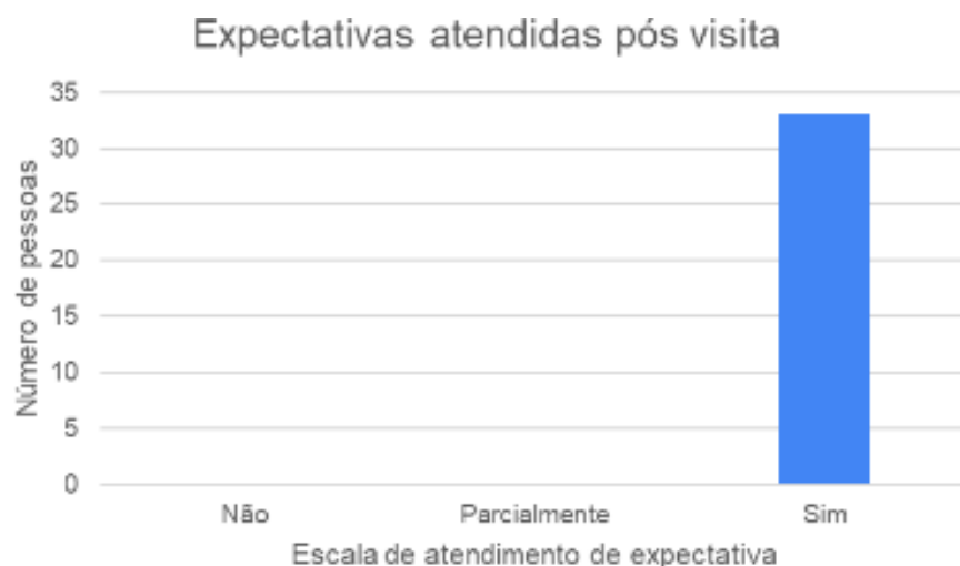
Figura 9: Nível de expectativa pós visita na empresa RBMWeb.