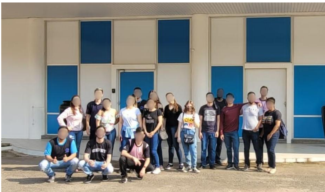
Figura 6: Estudantes durante a visita à empresa RBMWeb