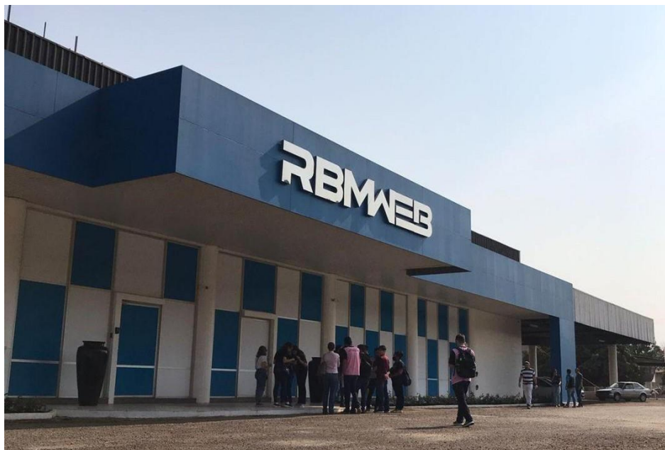
Figura 8: Sede da empresa RBM Web.