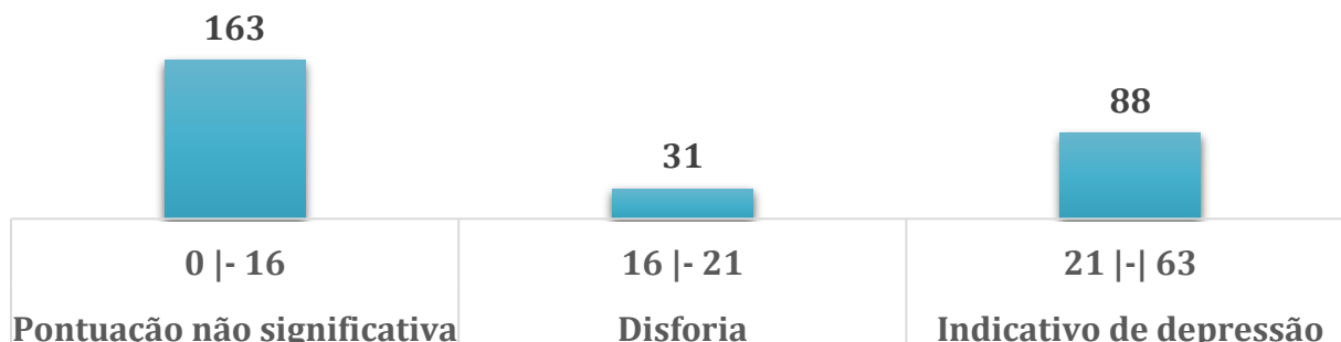
Gráfico 1. Pontuação do inventário de Beck de usuários de uma Unidade Matricial de Saúde. Uberaba, 2013.

A presença de disforia e indicativo de depressão foi mais prevalente na população idosa, conforme mostra o gráfico 2. A idade