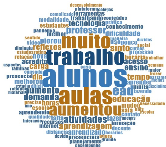
Figura 1: Palavras mais frequentes dos docentes ao se referirem ao trabalho com o ensino remoto.