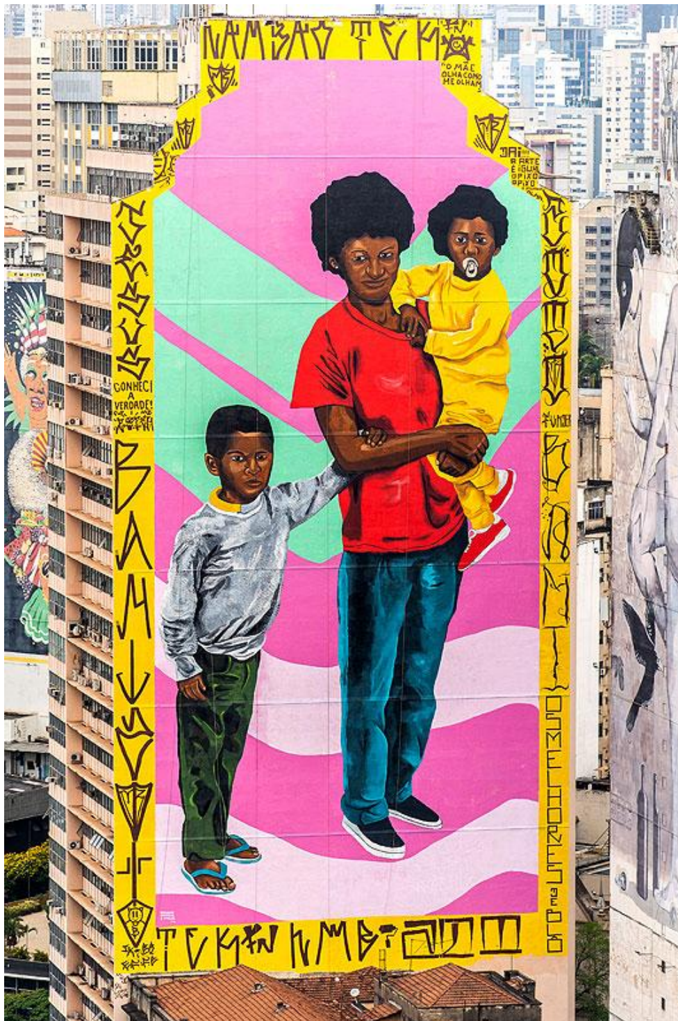
Figura 1: Mural Robinho Santana