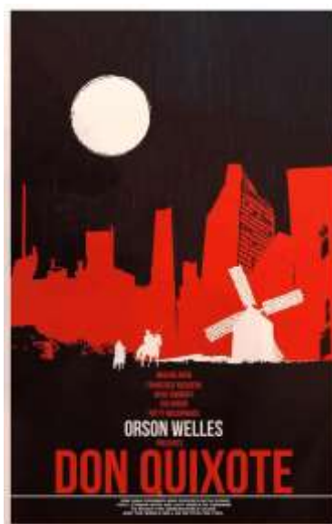
Figura 3 - Cartel para la película Don Quijote dirigida por Orson Welles y Jesús Franco, 1992

Asimismo, el impulso enriquecedor de las novedosas experiencias propiciadas por el viaje tanto del Alonso Quijano convertido en el Quijote como de su fiel escudero Sancho Panza, también abren espacios para una exploración temporal del presente dentro de una gramática de la sorpresa y del asombro, del azar, de lo imprevisible y discontinuo y, por ende, de aquello que escapa a los controles acostumbrados.