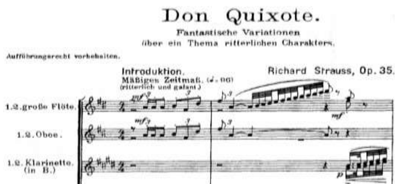
Figura 1- Introducción del poema sinfónico Don Quijote

Fuente: Variaciones fantásticas sobre un tema de carácter caballeresco, Op. 35 , compuesto por Richard Strauss, 1897 (PARDO, J. P., 2015)