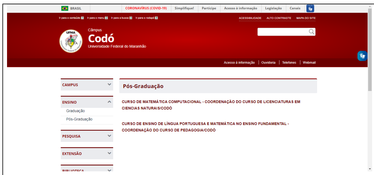
Imagem 01: print da página do portal da UFMA/Codó

No ano de 2015, o curso de Pedagogia foi reaberto, entretanto, com uma formatação do Projeto Político Pedagógico voltado para as necessidades da microrregião de Codó. O campus continua crescendo com responsabilidade e qualidade, vivendo o seu lema: a vida é combate! 3